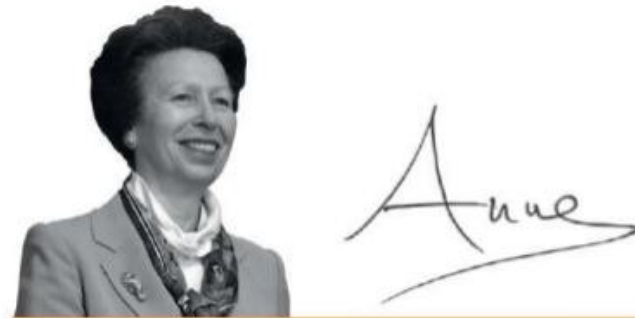
HRH The Princess Royal President, City and Guilds of London Institute

本 部：英国ロンドン 設 立：1878年 理事長：アン王女 社員数：約1,500人（五大陸）