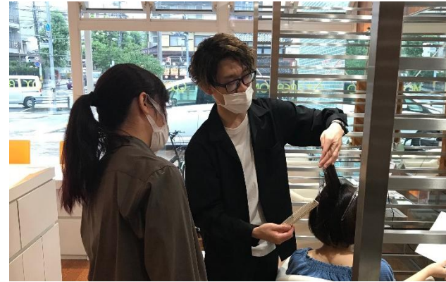
インターンシップ (スポンサー先へ訪問)