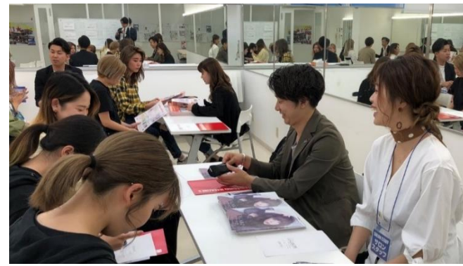
校内就職ガイダンス (スポンサー企業参加)