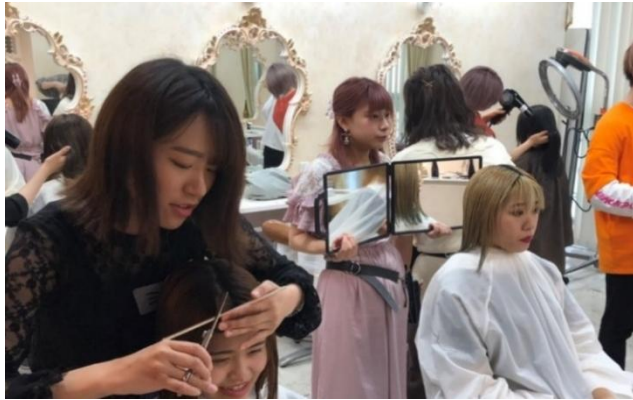
必修科目・選択授業 短期対策授業