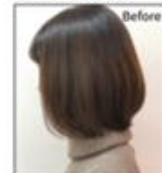
スタイルチェンジの例

下記いずれかの技法を用いてブロードライを行い、仕上げること。 ※必ずデンマンブラシ・ロールブラシいずれかの道具を使用すること。 ◆ストレートヘアにする ◆ボリュームを出す ◆動きをつける ◆カールをつける